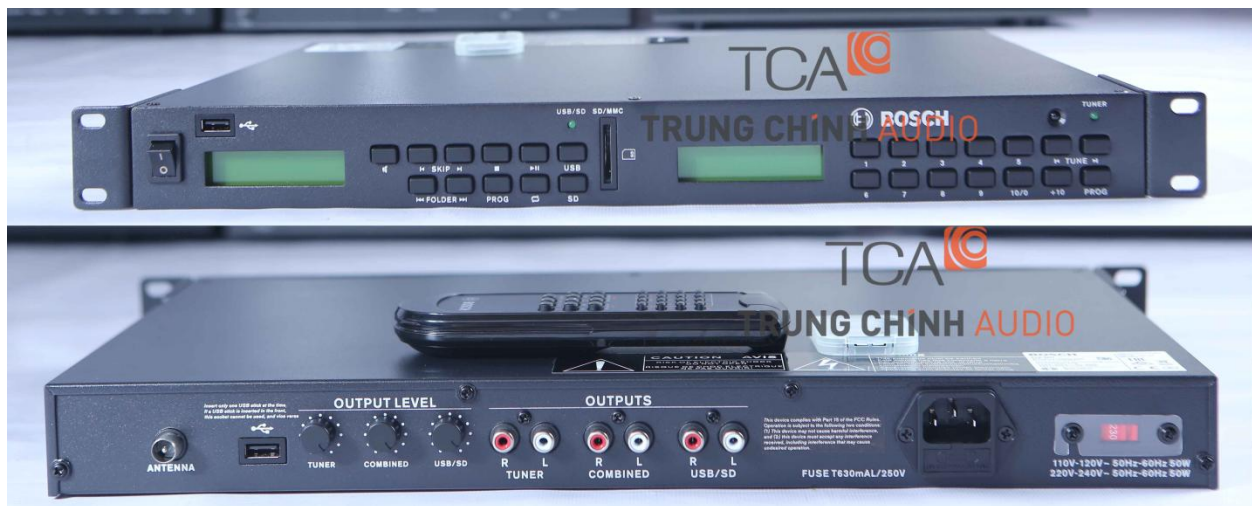
Hình ảnh sản phẩm