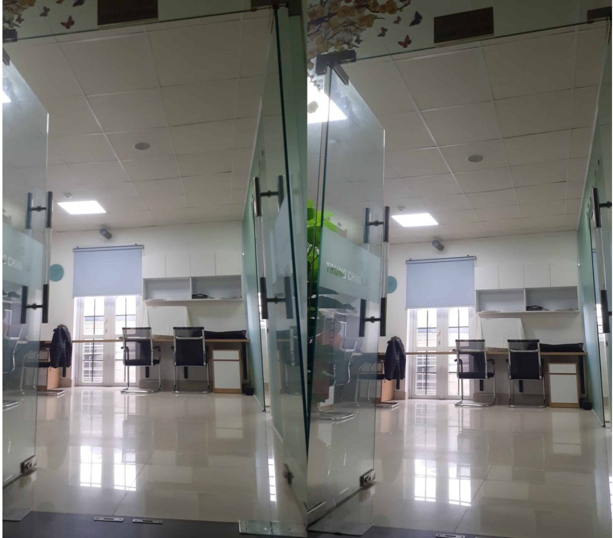
Yếu tố diện tích khi tư vấn hệ thống âm thanh hội nghị