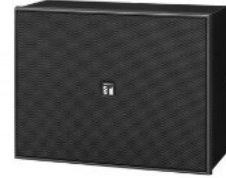
Loa hộp treo tường 6W TOA BS-678BT