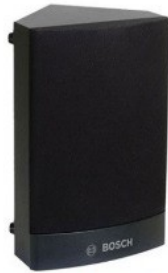
Loa hộp 6W Bosch LB1-CW06-D1