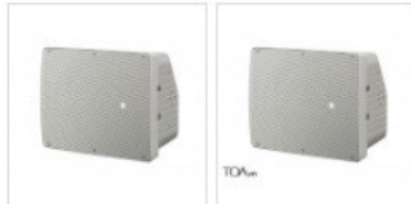
Danh sách loa 150W công suất