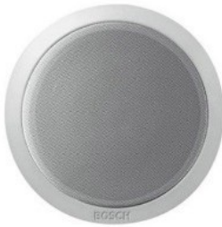
Loa âm trần 6W BOSCH LHM0606/10