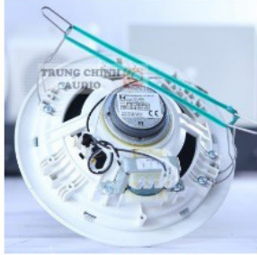
Loa âm trần 6W TOA PC-658R