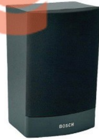
Loa hộp 6W BOSCH LB1-UW06-D1