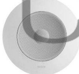
Loa âm trần 9/6W BOSCH LBC3951/11