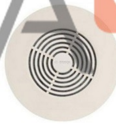
Loa âm trần 9/6W BOSCH LBC3950/01