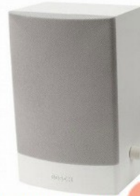
Loa hộp 6W Bosch LB1-UW06-L1